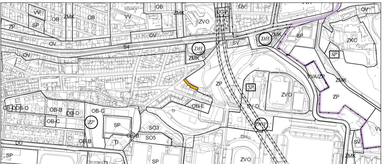
Zářez zadání změny schválený usnesením ZHMP č. 25/25 ze dne 30. 3. 2017